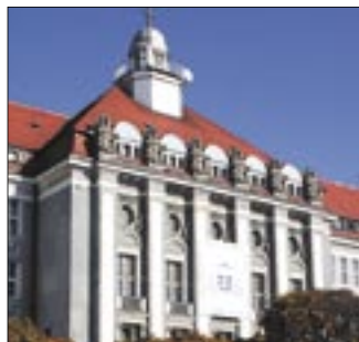
Gmach seminarium budzi spore zainteresowanie, również to architektoniczne.